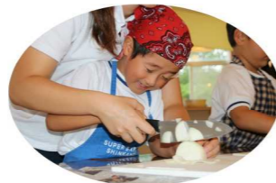
自分たちで野菜の皮をむいたり、 先生たちと一緒に包丁を使って お料理しました。