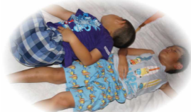
それぞれのスタイルで、 みんな夢の中!