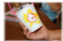
ステキな模様の提灯作り!