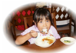
みんなで作ったカレーライスは絶品! モリモリ食べたね