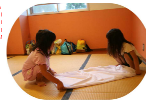
使った布団はみんなで 協力して畳みました!