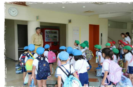
いよいよお泊まり保育スタート! ろれあい館の方に元気にご挨拶