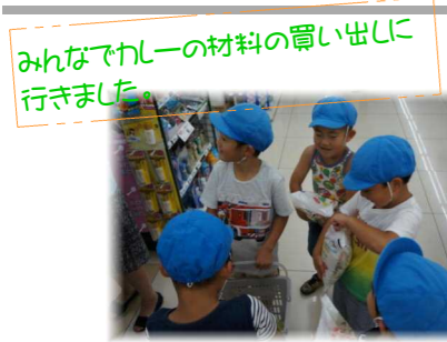
みんなでカレーの材料の買い出しに 行きました。