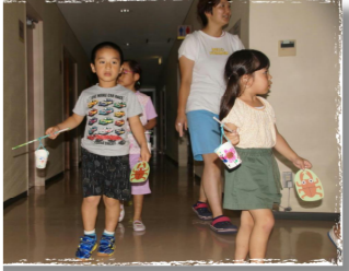
自分たちで作った提灯を持って、 夜のお散歩に出かけました。 ちょっぴり怖かったけれど、虫たち を見つけました。