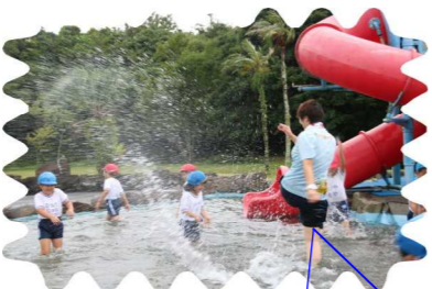
じゃぶじゃぶ池気持ちよかったね!